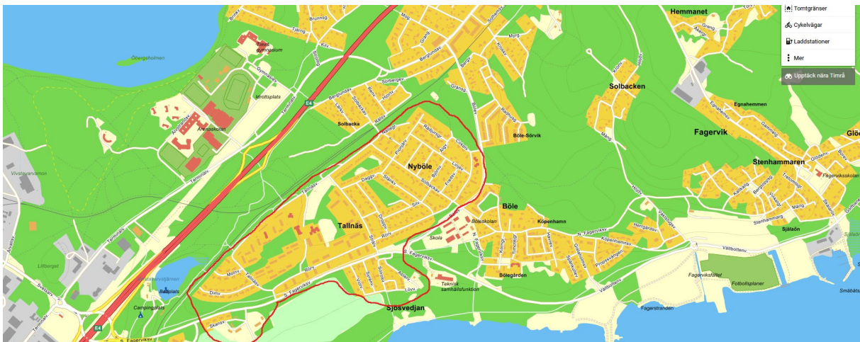
Figur 1 Illustration av studerat område

Sammantaget nådde enkäten 702 respondenter av vilka 196 valde att besvara den. Det ger en svarsfrekvens på 27,9 procent. Även om svarsfrekvensen är begränsad kompenseras den av faktumet att undersökningen vände sig till en totalpopulation, dvs. samtliga hushåll i det studerade området.